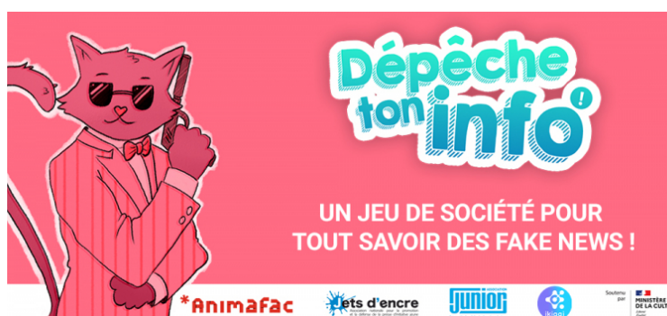
"Dépêche ton info" : jeu de société sur les fake news