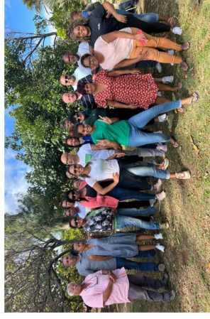
Capture d'écran de Journal.re