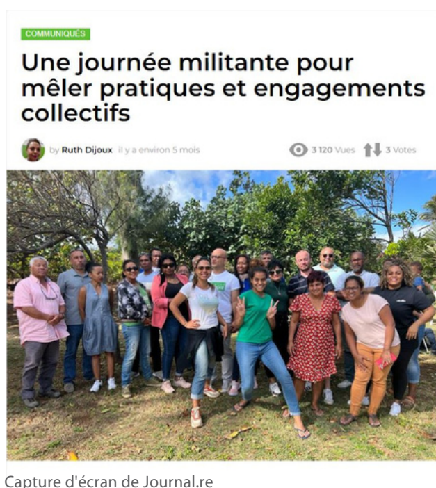
Capture d'écran de Journal.re

Il s'agit d'internautes qui souhaitent témoigner de ce qu'ils et elles voient, entendent ou constatent. Le public passe alors de simple récepteur à émetteur et acteur des médias et de l'actualité qui l'entoure !