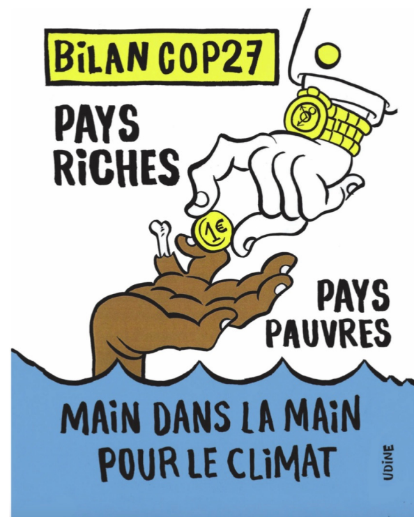
© Udine – Charlie Hebdo, n°1583, 23 novembre 2022

Les dessins de la semaine sont à retrouver soit sur Instagram ici @marge.mediadessine, soit sur le site internet de Dessinez Créez Liberté ! Le groupe est ouvert et n'attend que vos dessins.