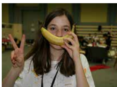
Mange une banane contre la maltraitance animale !

Le végétarisme est un engagement radical contre la société de consommation, la maltraitance animale et pour l'écologie. Cependant, pour les moins radicaux, une simple réduction de la consommation de viande est aussi bénéfique.