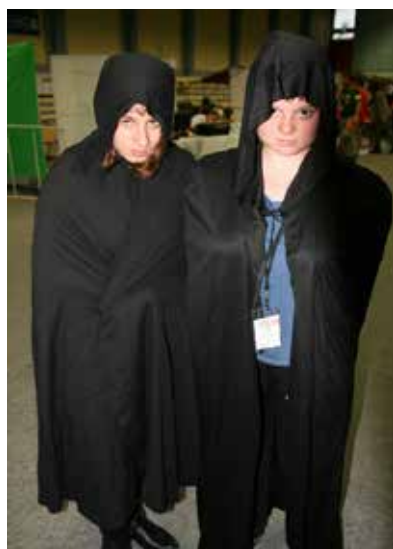
Une des rares photo de membres de la secte végétarienne.

L'industrialisation de la production de nourriture depuis le début des années 1950 a favorisé la consommation de viande. En effet, les conditions d'abattage des animaux se sont mécanisées et ont rendu plus rentable la transformation du bétail. Être végétarien c'est donc se placer contre ce système de production de masse, en privilégiant donc une production à taille humaine. Le but est aussi de se placer contre le gaspillage alimentaire qui résulte de la production en chaîne.